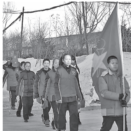
图为“青年志愿者”为农场社区的老人进行义务服务。右二为本文作者。