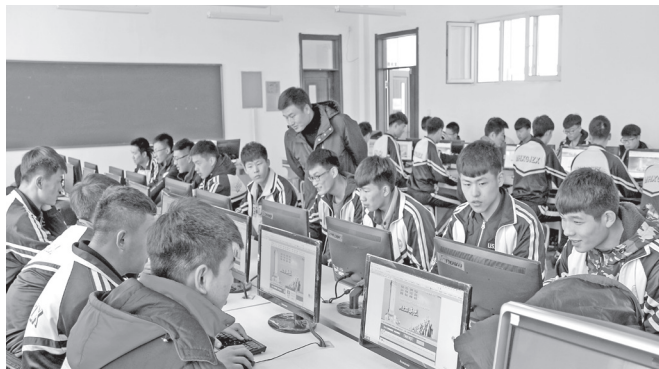
图 片 报 导

为在新一代垦区人中广泛宣传北大荒文化精神实质，管理局通过开展《我的北大荒人生》影像故事微信征文大赛，反映北大荒三代人为北大荒做出贡献的真实故事，征集作品160余篇，筛选刊发30余组，作品累计点击量达50余万次，掀起了广大青少年学习北大荒精神的热潮。各项活动的开展不仅宣传了自己，更促进了各单位之间的学习交流，达到取长补短、资源共享、弘扬正能量的目的。下一步，将开通“建三江关工委微信公众平台”；并在微信平台上第一时间发布各级关工委活动动态、消息等，形成效果良好的宣传态势，推动关心下一代工作深入开展。（建三江管理局关工委 刘加海）