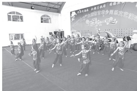
充分体现了校园文化和社会文化的良性互动。（安达市关工委 苏真和 王园园）

这次文艺演出活动旨在凝聚新思想，弘扬主旋律，传播正能量。整个演出主题突出，特色鲜明，丰富多彩。独唱、合唱、舞蹈、器乐合奏、情景剧等 48 个节目，个个引人入胜、扣人心弦。老年艺术团和中小學生齐唱的“颂歌献给党”，合演的“十送红军”，一次次把演出推向高潮，充分体现了校园文化和社会文化的良性互动。