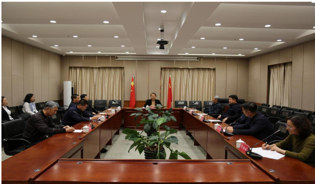
区委书记那君喆（中）主持会议