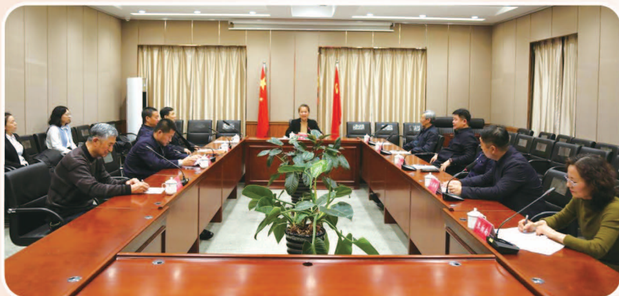
区委书记那君喆（中）主持会议。