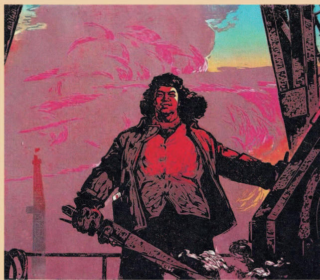
弘扬大庆（铁人）精神